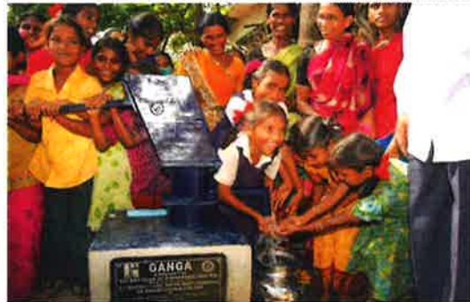
Intian Andra Pradeshin osavaltioon saatiin Oulun ja Lapin piirin rotarien avustuksella 133 kaivoa.

kaan toimintaan. Valtaosa jäsenistä alkaa olla 50–60-vuotiaita.