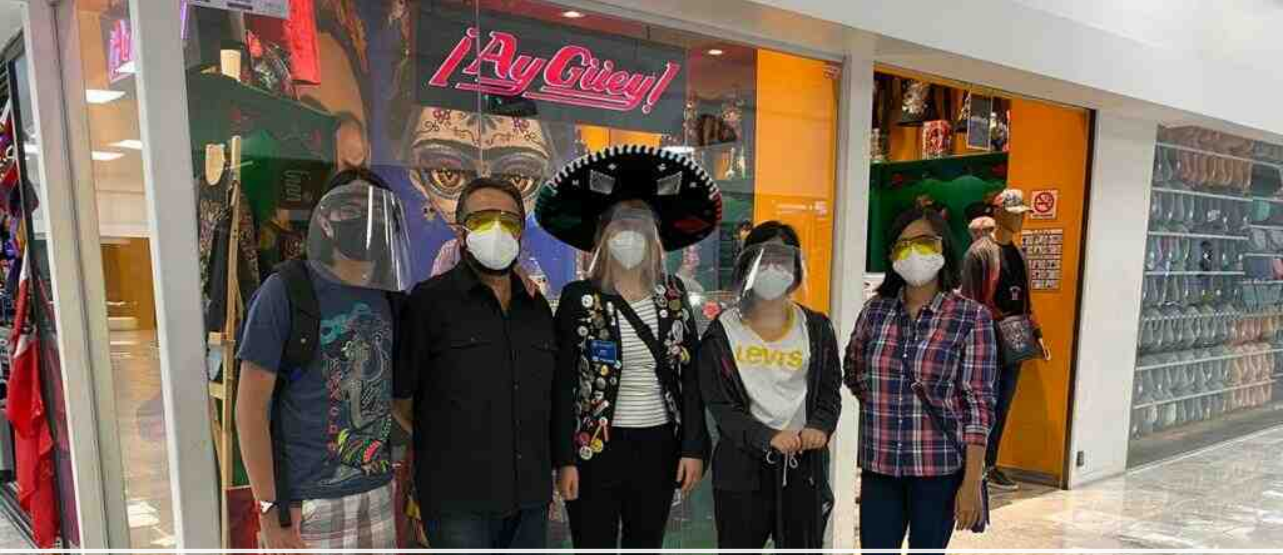
Paluu kotiin (14.7.2020)