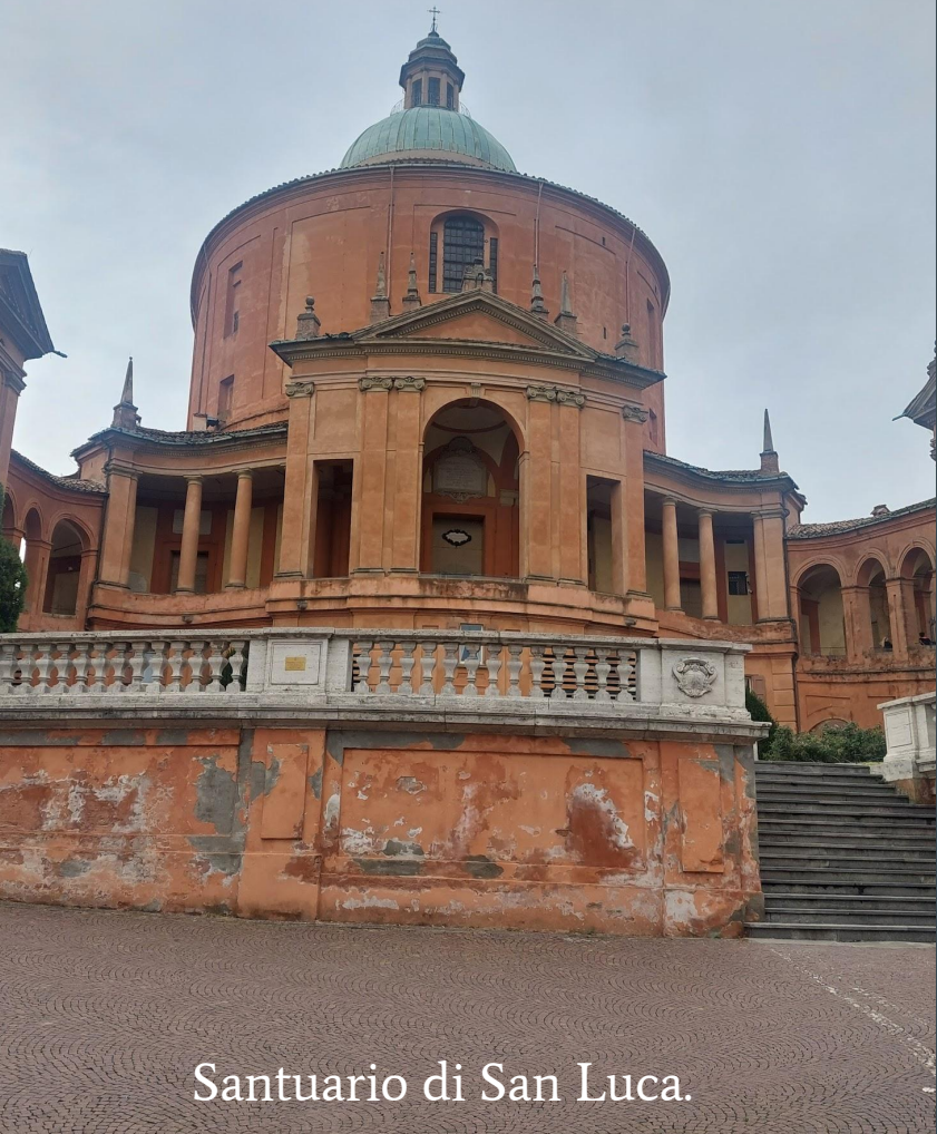
Santuario di San Luca.