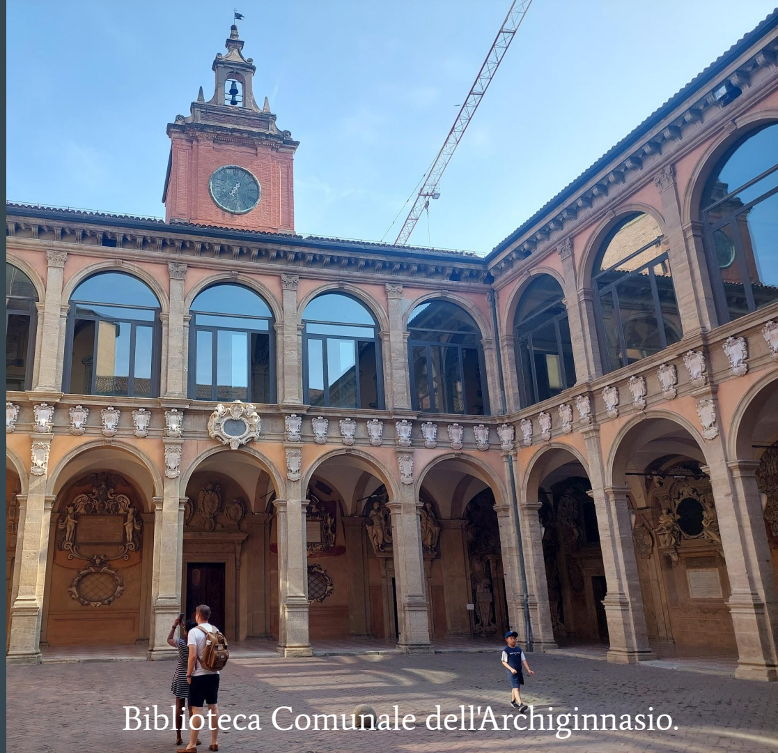
Biblioteca Comunale dell'Archiginnasio.