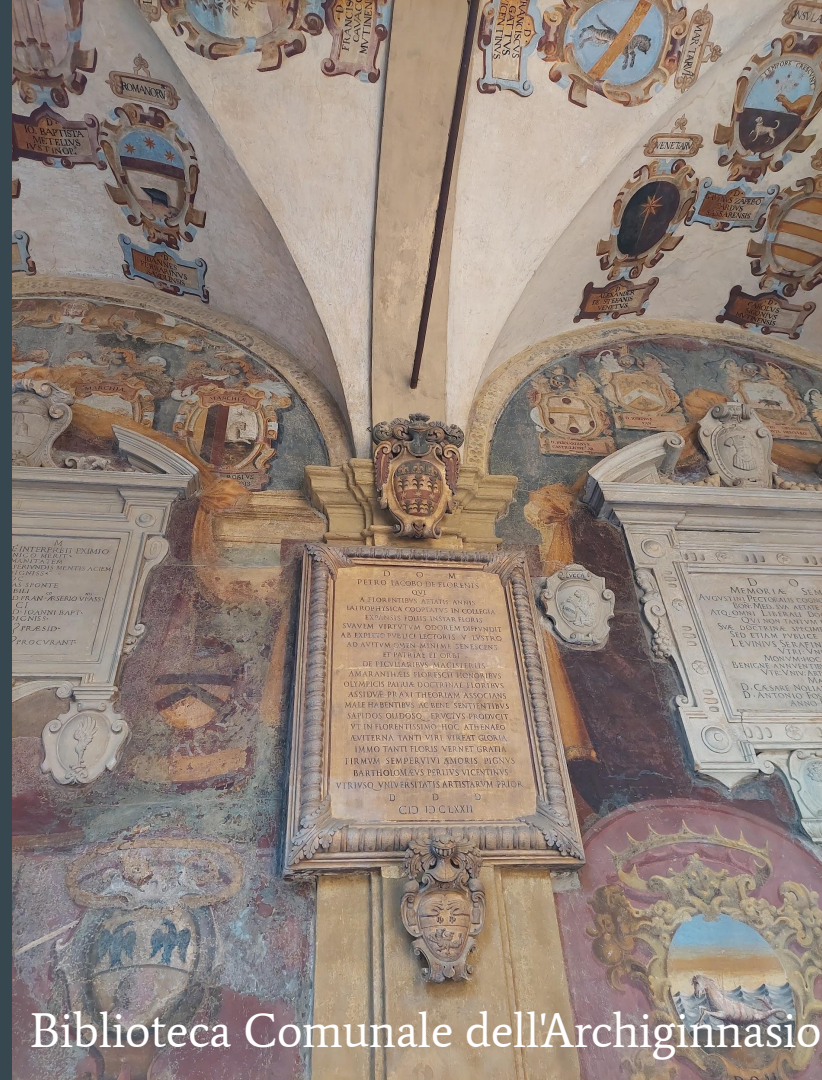
Biblioteca Comunale dell'Archiginnasio