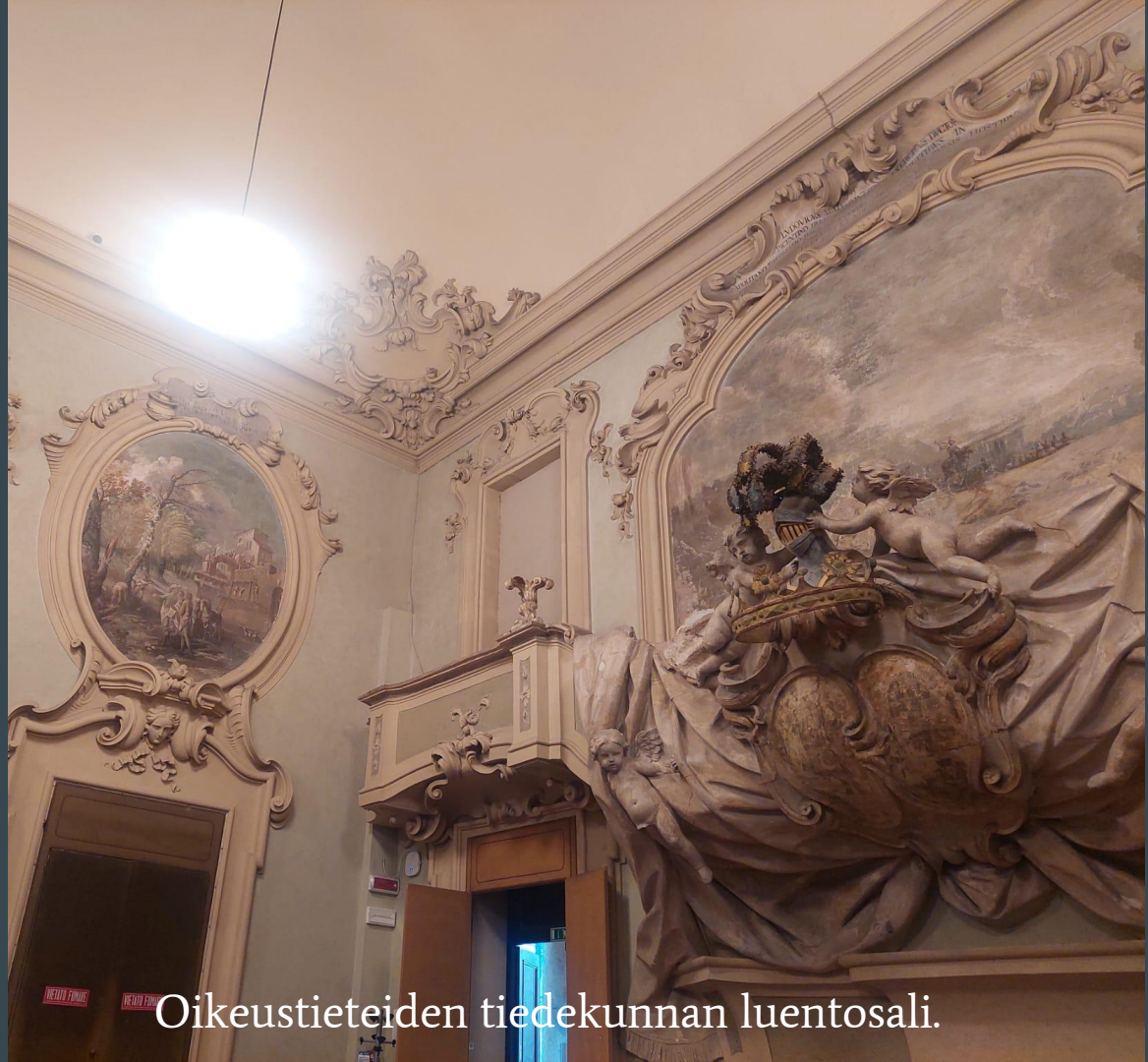
Oikeustieteiden tiedekunnan luentosali.