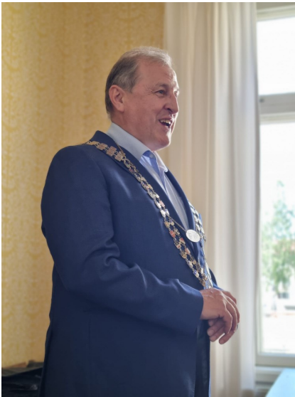
Viimeinen puhe käädyt kaulassa