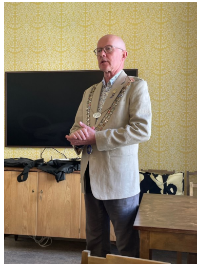
Paavon mietteitä tulevasta