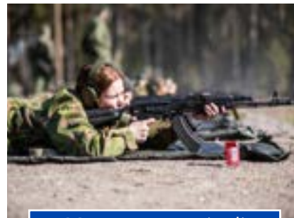
Muu asemateriaali 300.000