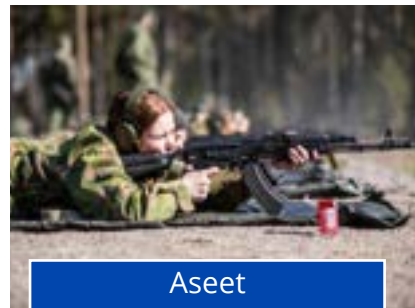
Aseet 2 100 000