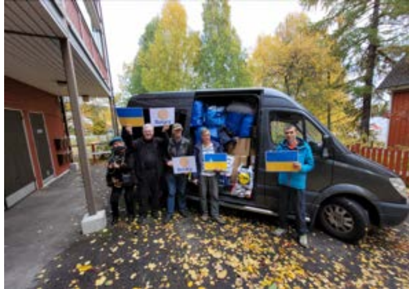
Kuva 3. Ikäläinen, tulkki ja Kaatratsalo ja Harkovan Rotaryklubin edustajat.

Todettakoon, että Puolan puolella ennen Ukrainan rajaa oli