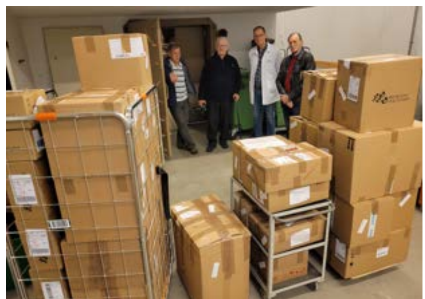
Kuva 1. Klubin jäseniä hakemassa tarvikkeita Mölnlyckeltä.