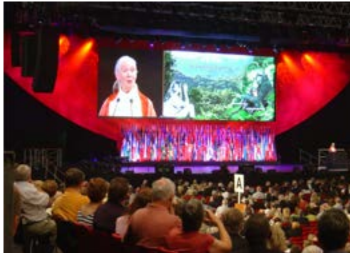
Kuva 1. Rotarykonventiossa Birminghamissa 21-24.6.2009 pääsi näkemään haukkametsästystä keskiaikaisen linnan pihalla, nahkaesiliinaisen kultasepän työskentelyä 1800-luvun pajassa, sekä maailman tunnetuimman simpanssitutkijan Jane Goodallin esitelmää (kuvassa). Tuskin olisi ilman rotaria ollut mahdollisuutta kokea mitään näistä. Hullumminkin voisi juhamusta viettää.

Sivulta 2 / klubien viestintävastaavat...