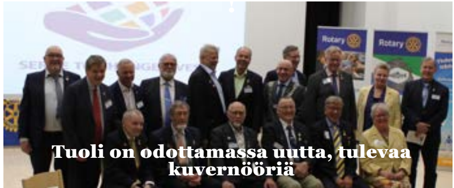
Tuoli on odottamassa uutta, tulevaa kuvernööriä