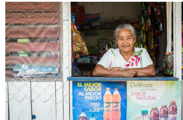
COMMUNITY ECONOMIC DEVELOPMENT