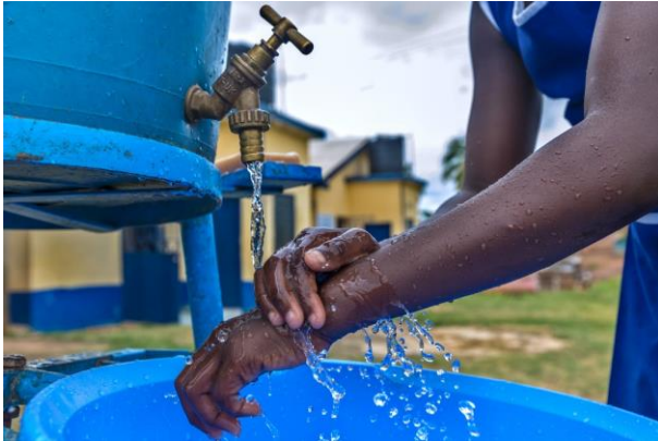
WATER, SANITATION, AND HYGIENE