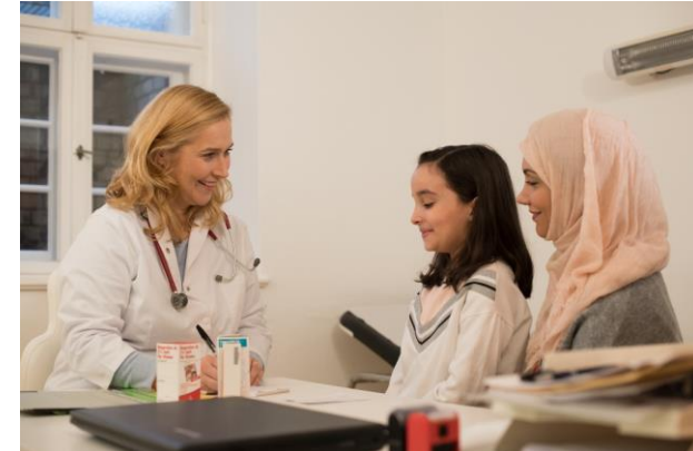
DISEASE PREVENTION AND TREATMENT