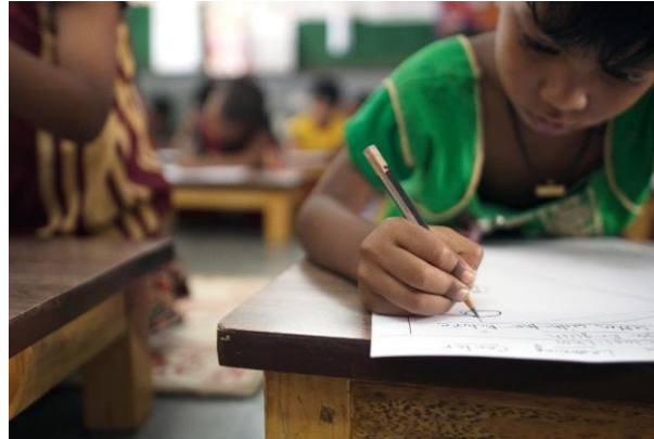
BASIC EDUCATION AND LITERACY