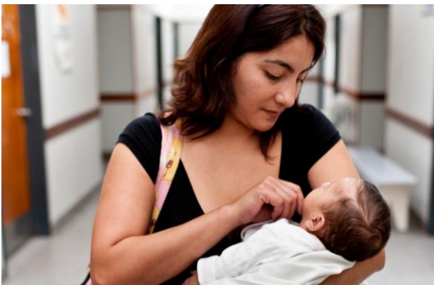
MATERNAL AND CHILD HEALTH