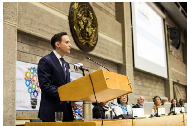
PEACEBUILDING AND CONFLICT PREVENTION