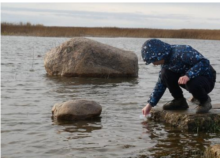
Koululainen ottamassa vesinäytettä.

Kesällä 2024 jatkamme taas Suomen rotarypiirien hyvää yhteistä projektia Suomen ympäristökeskus Syken kanssa. Lähivesien ja Itämeren sinilevätilanteen havainnointimme on arvostettu sekä tervetullut lisä Syken havaintoverkoston. Samalla se on arvokasta kansalaistoimintaa tutkimuksen ja ympäristön hyväksi.