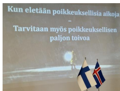
Kuva Jarno Limnellin esitelmästä

Rotaryseminaarin esityksiä löytyy piirin DropBoxista: D1390/HALLINTO/2023-2024/PIIRIKOKOUS 2023/Rotaryseminaarin aineistoja.