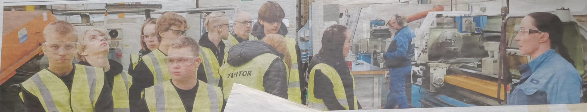
Päivän aikana jokainen Akaan yhdeksäsluokkalainen pääsi tutustumaan kahteen eri yritykseen. Tässä ollaan Toijala